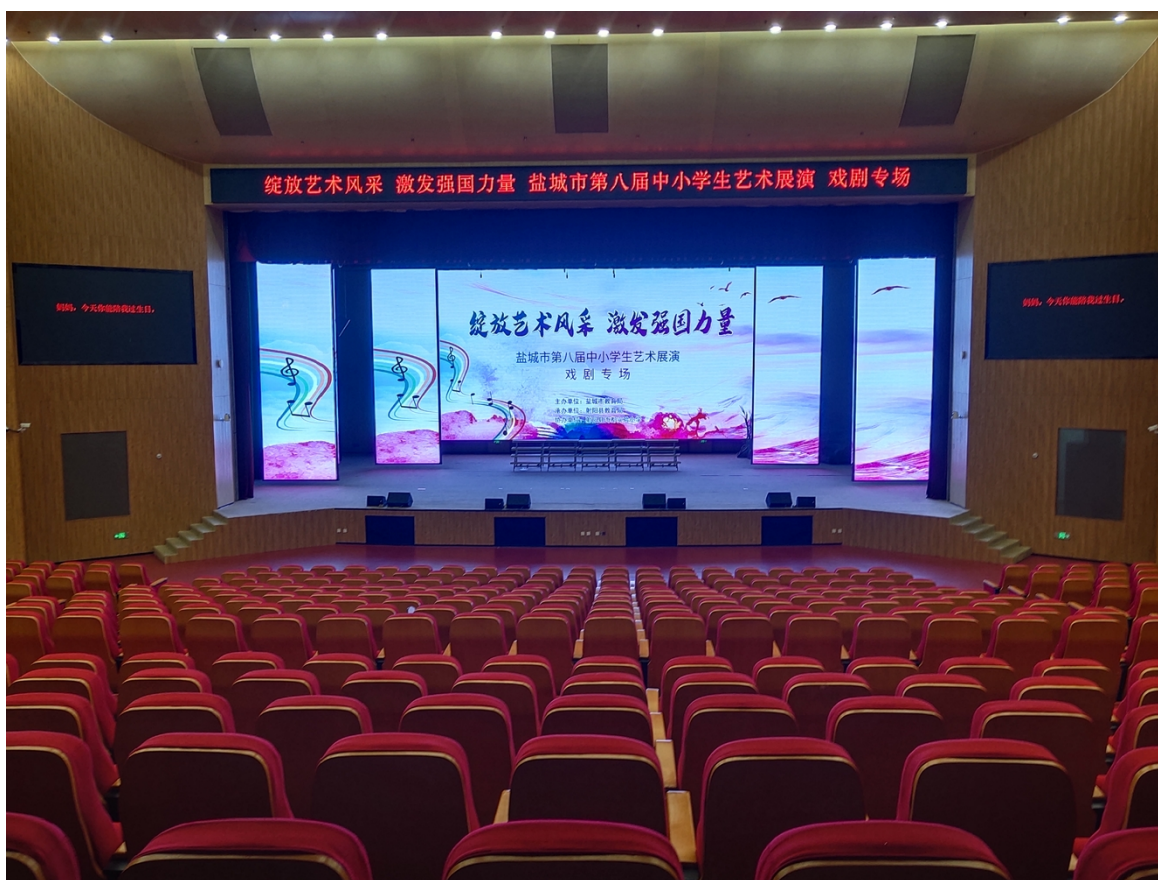
现场效果图（可表演区域内侧长度 15 米，外侧长度 20 米，深度 13 米）