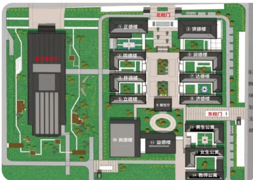
文体中心平面示意图